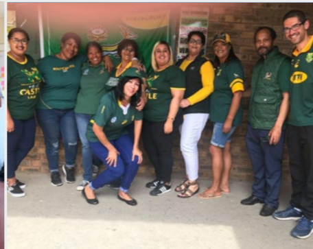
Afrique du Sud Lavalla200> Atlantis