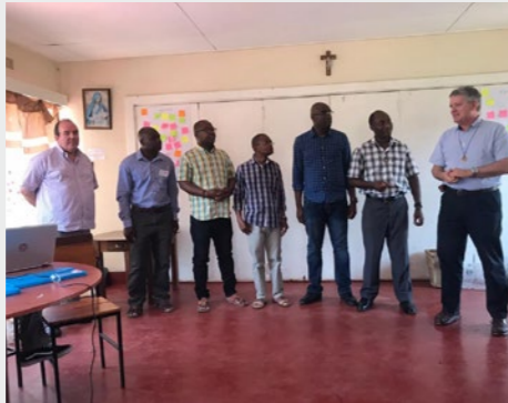
Malawi Nouveau Conseil Provincial d'Afrique Australe