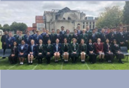
NUEVA ZELANDA: ENCUENTRO DE LÍDERES DE COLEGIOS MARISTAS