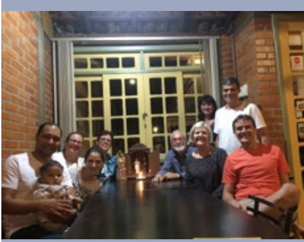
BRASIL: FRATERNIDAD SAGRADA FAMILIA DEL MCFM EN CURITIBA