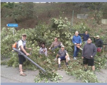
LIMPIEZA DEL JARDÍN EN LA CASA GENERAL