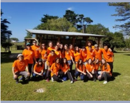
URUGUAY: CAMPAMENTO FAMILIAR 2020 DEL COLEGIO MARISTAS SAN LUIS, PANDO