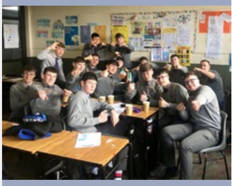
IRLANDA: MARIST ATHLONE