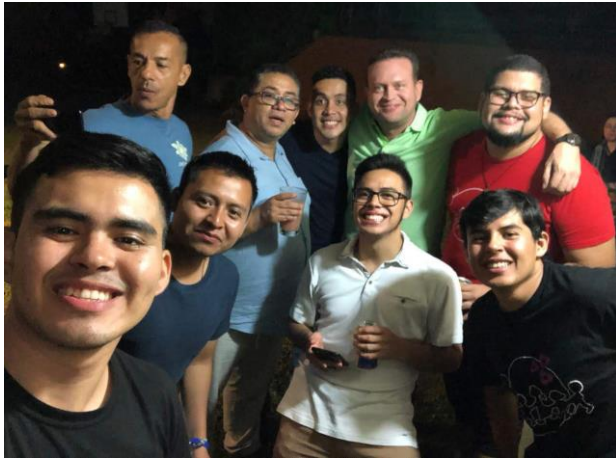
Compartir con hermanos y laicos del Equipo Económico y Consejo de Misión de Norandina.