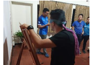
Compartir fraterno de la comunidad.