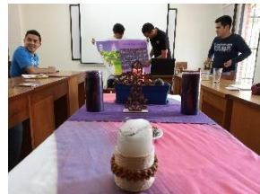
Introducción al tiempo litúrgico de cuaresma.