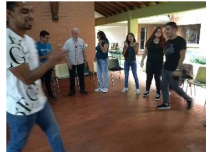
Planeación pastoral con los animadores.