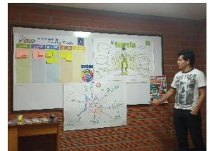
Taller «Coaching y pedagogía marista».