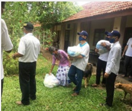
ÉQUATEUR: COMMUNAUTÉ À QUITO