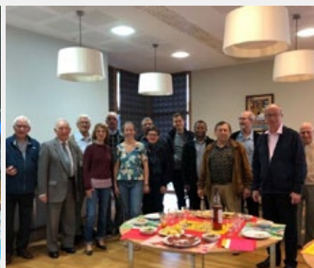
FRANCE – HERMITAGE