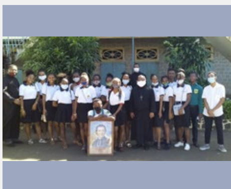
MADAGASCAR – ANTSIRANANA