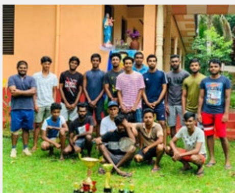
SRI LANKA, HALDANDUWANA