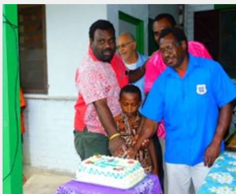
VANUATU – SANTO