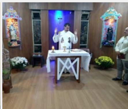
BRÉSIL, BELO HORIZONTE