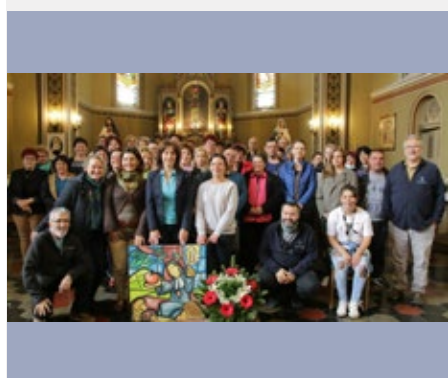
HONGRIE – KARCAG