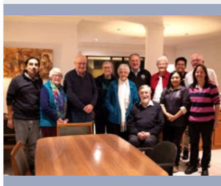
AUSTRALIE, MOUNT DRUITT