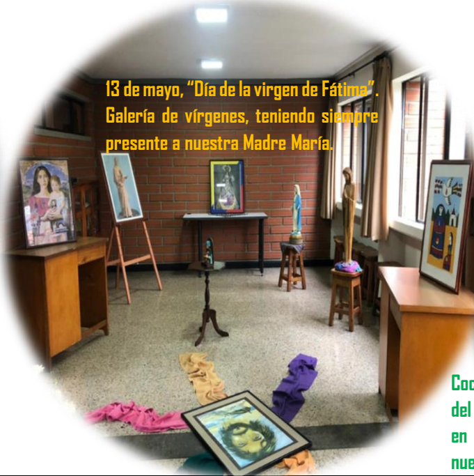
13 de mayo, "Día de la virgen de Fátima". Galería de vírgenes, teniendo siempre presente a nuestra Madre María.