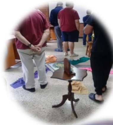
Descubriendo nuestro espíritu mariano con nuestros Hermanos.