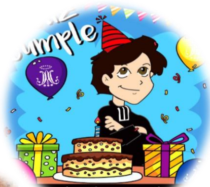
San Marcelino Champagnat 20 mayo