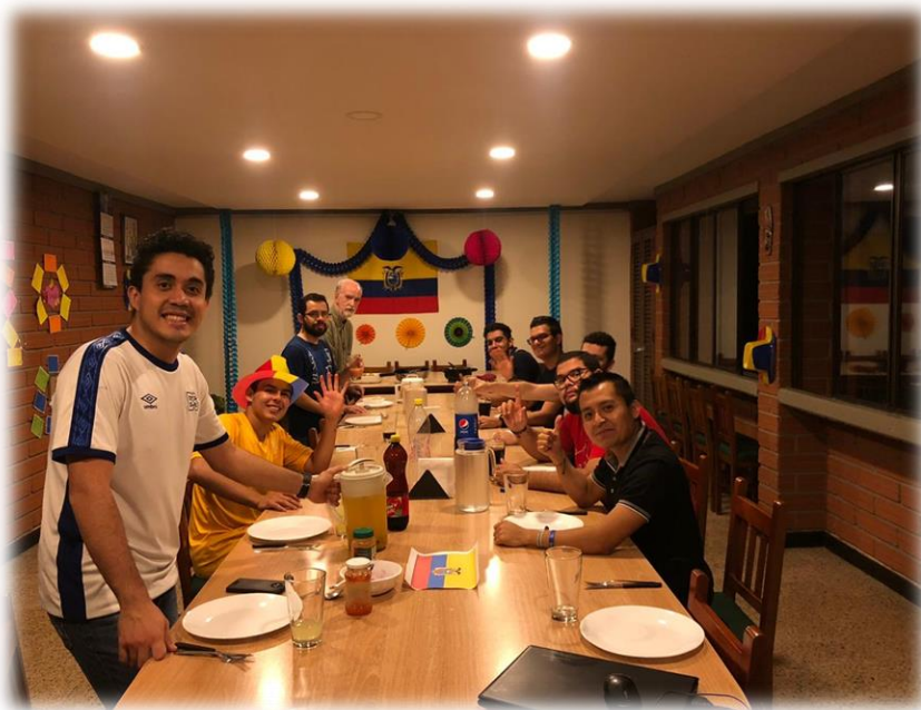
Presentación del Ecuador