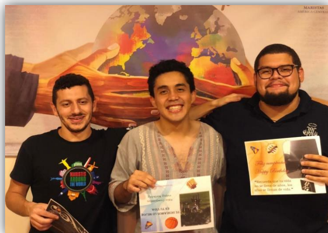
Cumpleañeros del mes