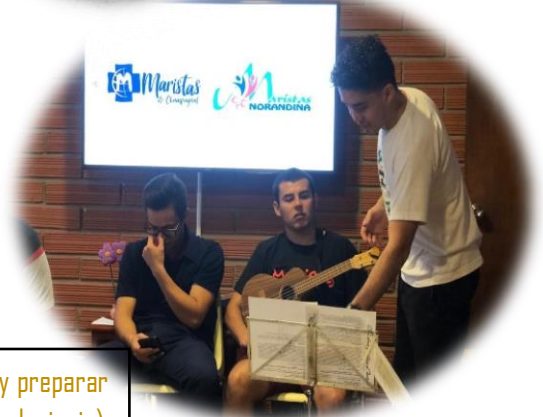
Ensayo de cantos: una forma de celebrar y preparar el día de San Marcelino Champagnat (6 de junio), compartiendo alegría con toda la comunidad marista a través de la música.