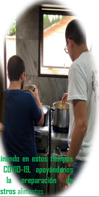
Cocinando en estos tiempos del COVID-19, apoyándonos en la preparación de nuestros alimentos.