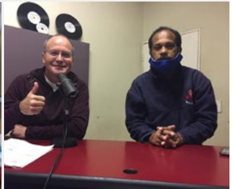
AUSTRALIA: PASTORAL JUVENIL MARISTA – SYDNEY