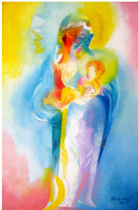
Portada: "Buena Madre", Pintura original encargada por de los Hermanos Maristas de Canadá al artista Stephen B. Whatley.