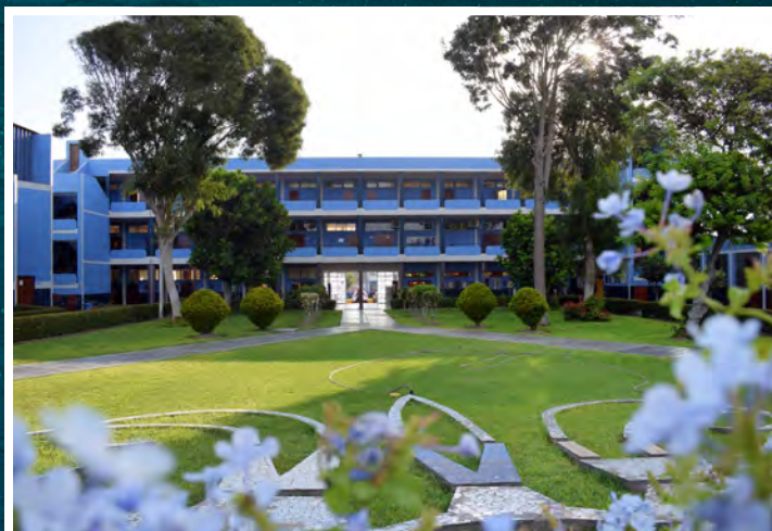
COLEGIO SAN JOSÉ HERMANOS MARISTAS CALLAO. Fundado en 1909, primera obra Marista de Perú, ubicada en el Puerto del Callao, en camino a la acreditación en la excelencia educativa.