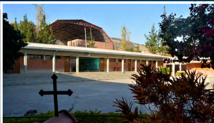
UNIDAD EDUCATIVA TÉCNICO HUMANÍSTICO SANTIAGO. Ubicada en la zona Ticti Norte de la ciudad de Cochabamba. Es un colegio fiscal de convenio, inicia labores educativas el año 2005 y celebra su aniversario el 25 de julio en honor a la fiesta del apóstol Santiago.