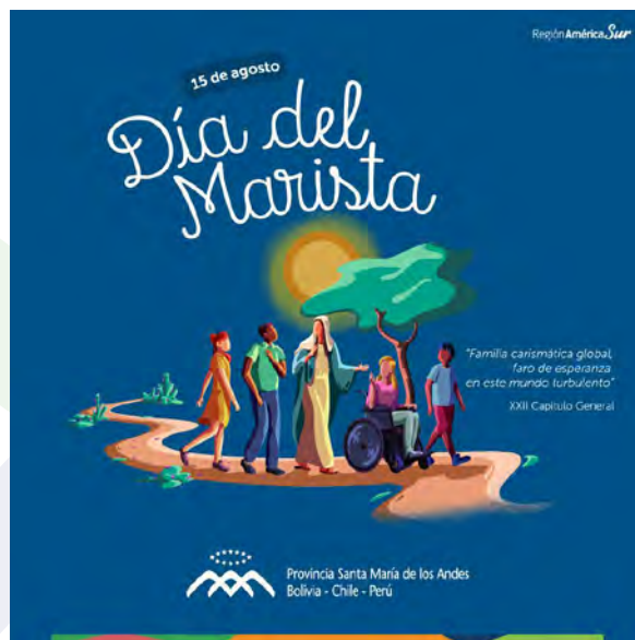
Saludo 15 de agosto, Región América Sur.