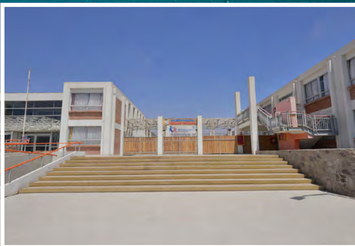
COLEGIO HERMANO FERNANDO, COLEGIO MARISTA ALTO HOSPICIO. Ubicado en la comuna de Alto Hospicio en el norte de Chile, desde 2007 imparte educación básica y media Técnico Profesional.