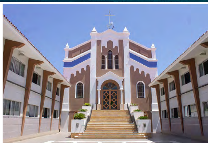
CEP SANTA ROSA - SULLANA. Desde 1939, ofreciendo una formación orientada a los valores Maristas, ubicado en el norte del Perú en el departamento de Piura.