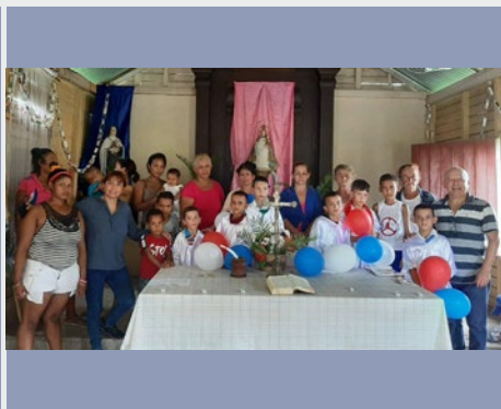
CUBA: HOLGUÍN, LAVALLA200>