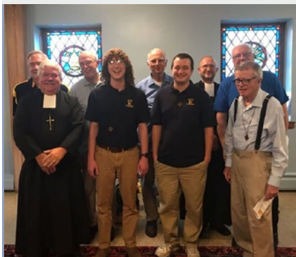
ÉTATS-UNIS: NOUVEAUX POSTULANTS