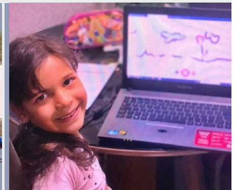
BRASIL: COLÉGIO MARISTA CHAMPAGNAT – TAGUATINGA