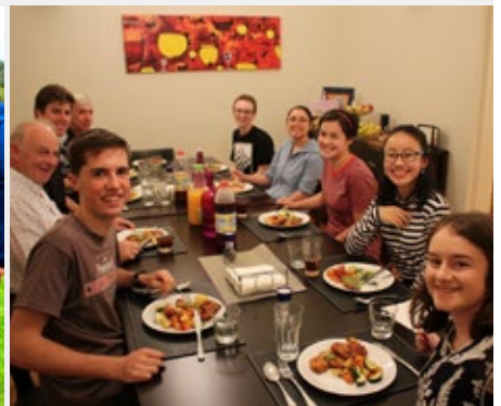
AUSTRALIA: MARIST HOUSE – MELBOURNE