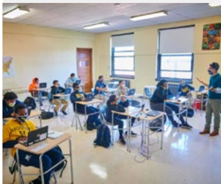
ESTADOS UNIDOS: MOUNT ST. MICHAEL ACADEMY, CHICAGO