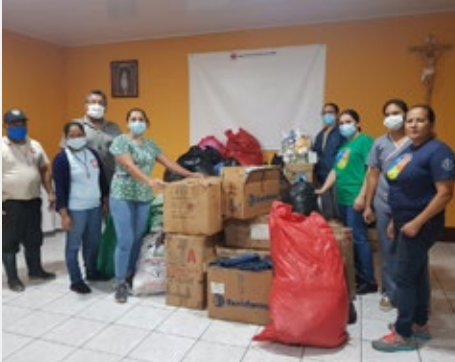
GUATEMALA: COMUNIDAD EDUCATIVA DE CONDEGA. AYUDA A LOS AFECTADOS POR EL HURACAN ETA