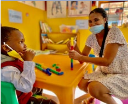
SUDÁFRICA: MARIST MERCY CARE SOUTH AFRICA