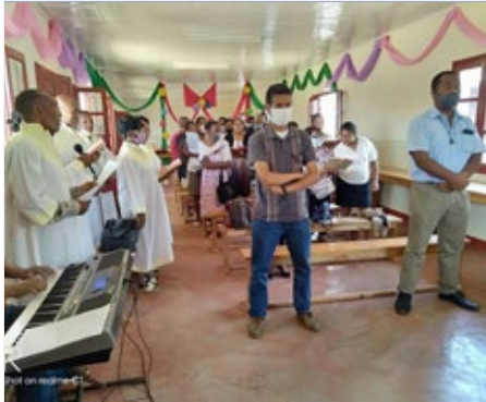
MADAGASCAR: INAUGURATION OF THE NEW BUILDING OF THE "COLLÈGE IMMACULÉE CONCEPTION ANTSIRABE"