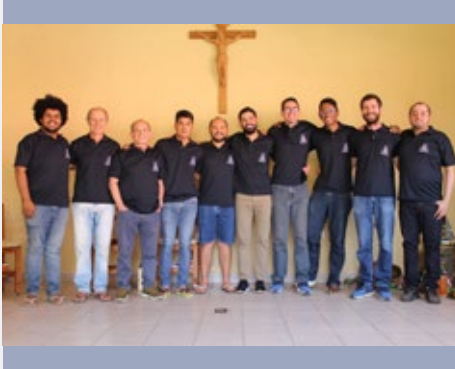
BOLIVIA: CHAMPAGNAT'S NOVITIATE – COCHABAMBA