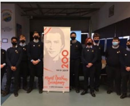
IRELAND: MARIAN COLLEGE IN DUBLIN – NEW GROUP OF MARIST LEADERS