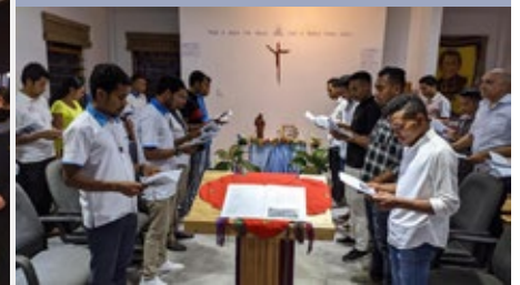
EAST TIMOR: MARIST POSTULANTS 2020