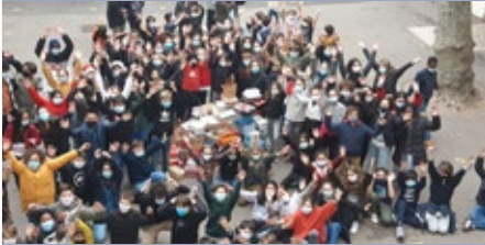
FRANÇA: COLLÈGE-LYCÉE-NOTRE DAME LES MARISTES – MARSELLA