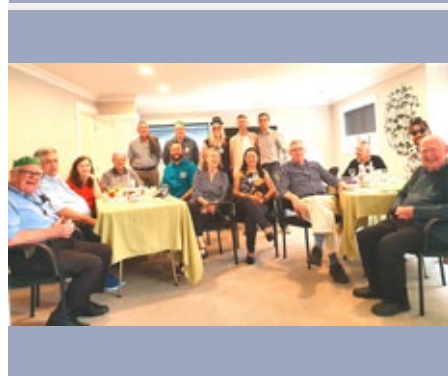
NOVA ZELÂNDIA: CHAMPAGNAT MARIST CENTRE