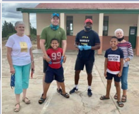
ÁFRICA DO SUL: MARIST MERCY CARE SOUTH AFRICA