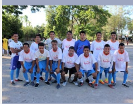
TIMOR LESTE: JOVENS MARISTAS