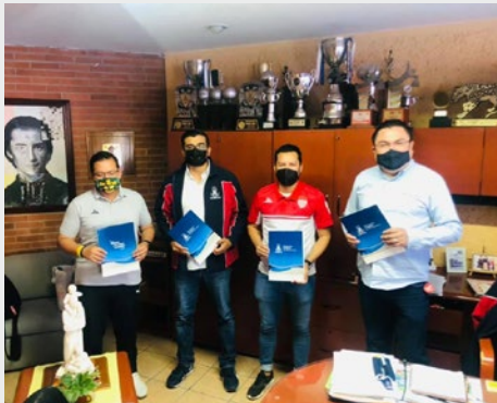
MÉXICO: ESCOLA MARISTA CELAYA