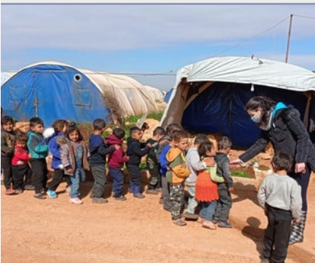
SÍRIA: MARISTAS DE ALEPO