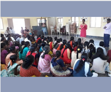
ÍNDIA: MARCELLIN TRUST – OPERATION RAINBOW