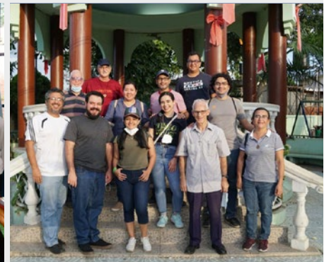
EL SALVADOR: COMUNIDADE DE PASTORAL JUVENIL EM MEJICANOS