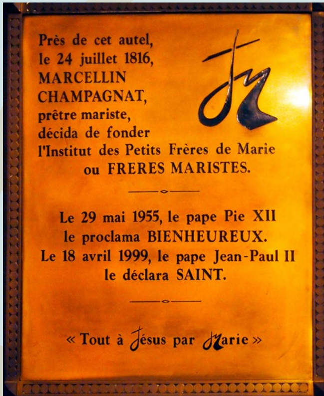
Plaque commémorative dans la chapelle de N.D. de Fourvière.

En réfléchissant à ces situations, je pense à Marcellin comme un homme de vision. Son regard a su percevoir un horizon bien au-delà de ses propres frontières et limites. Plusieurs épisodes de sa vie montrent clairement qu'il ne s'est pas découragé devant les difficultés, et même que celles-ci ont renforcé sa capacité de résilience. À ce sujet, je présente quelques événements qui me viennent à l'esprit concernant la capacité de Champagnat à voir au-delà :