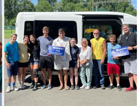
MADAGASCAR: LAICOS Y JÓVENES MARISTAS EN ANTSIRANANA