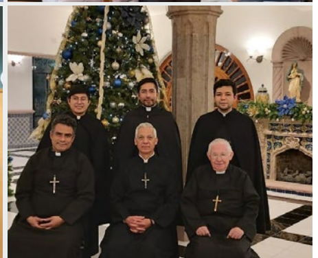
ESPAÑA: CAPÍTULO PROVINCIAL DE COMPOSTELA