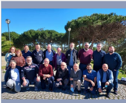
PORTUGAL: EQUIPES EUROPEUS DE MISSÃO E VIDA MARISTAS EM LISBOA