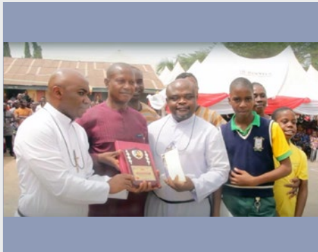
NIGÉRIA: JUNIORATO DOS IRMÃOS MARISTAS, UTURU