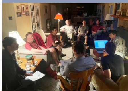
ESTADOS UNIDOS: COMUNIDADE DE ACOLHIDA DE AUSTIN