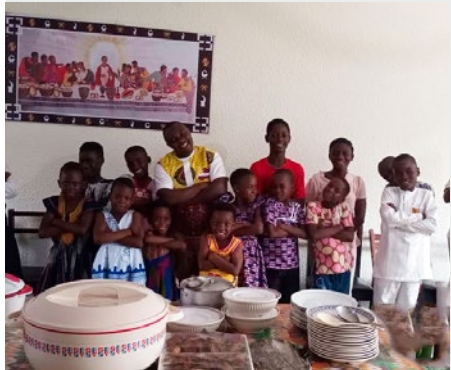
GHANA: POSTULANTADO, AHWIREN