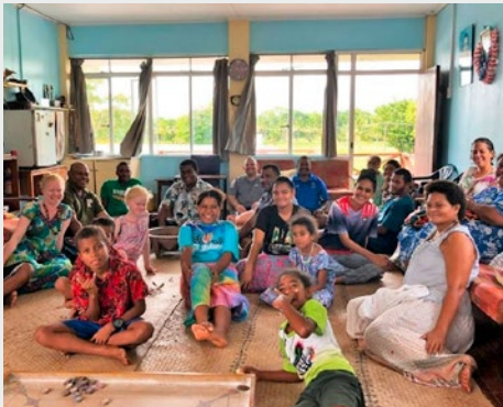
FIJI: LA COMUNIDAD MARISTA DE SUVA CELEBRA EL ANIVERSARIO DEL INSTITUTO