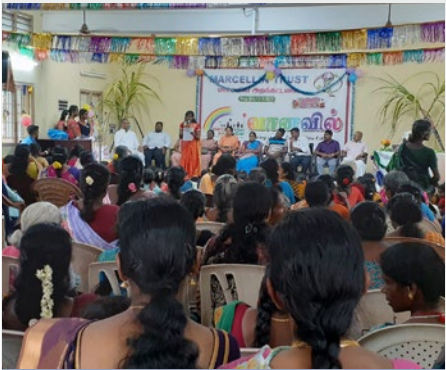
INDIA: MARCELLIN TRUST – OPERATION RAINBOW PROJECT