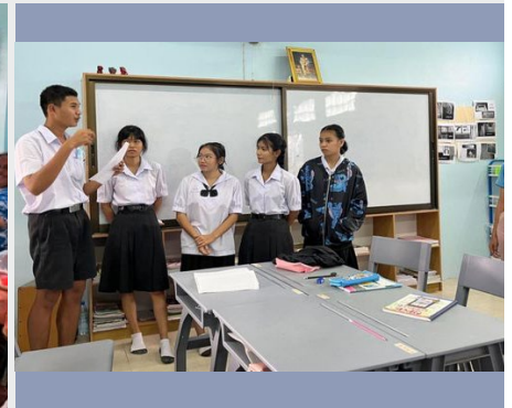
TAILANDIA: AUSTRALIAN MARIST SOLIDARITY – PROGRAMA DE SECUNDARIA PARA MIGRANTES

de seguir acortando las barreras de la comunicación tanto en el entorno educativo, como fuera de él; de esa manera estamos reduciendo toda forma de exclusión y marginación con estos “hijos menos favorecidos”.