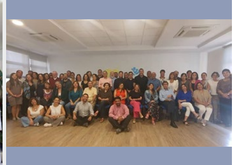
CHILE: PRIMERA REUNIÓN DEL AÑO DE DIRECTIVOS MARISTAS EN SANTIAGO