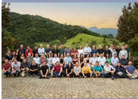
BRASIL: CURSO DE LIDERAZGO PROFÉTICO SERVICIAL DE BCS.