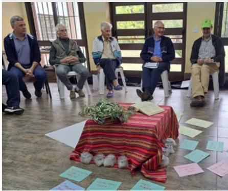
ARGENTINA – CRUZ DEL SUR: ENCUENTRO DE ANIMADORES COMUNITARIOS EN LUJÁN