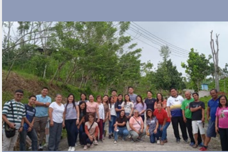
FILIPINAS: RETIRO DE CUARESMA DE LA FAMILIA MARISTA EN EL CENTRO MARISTA DE ESPIRITUALIDAD Y MISIÓN EN ASIA