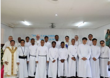
FILIPINAS: PRIMERAS PROFESIONES EN TAMONTAKA