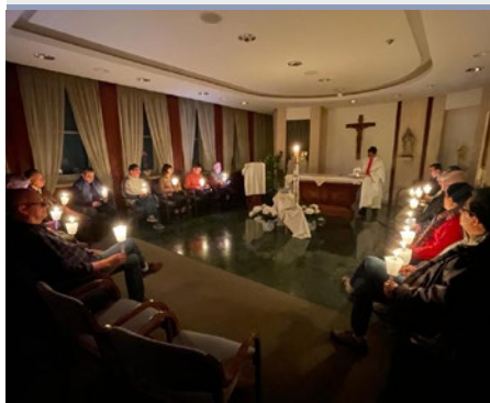
CASA GENERAL: PASCUA EN LA ADMINISTRACIÓN GENERAL