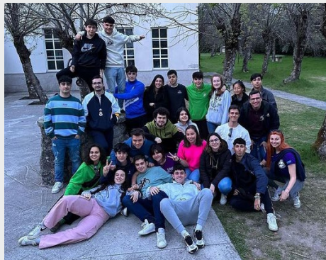
ESPAÑA: CELEBRACIÓN PASCUA JOVEN DE LOS MARISTAS DE IBÉRICA