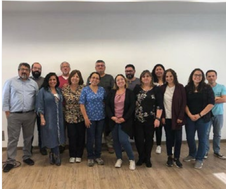
CHILE: REUNIÓN DE COORDINADORES DE EVANGELIZACIÓN EXPLÍCITA EN SANTIAGO