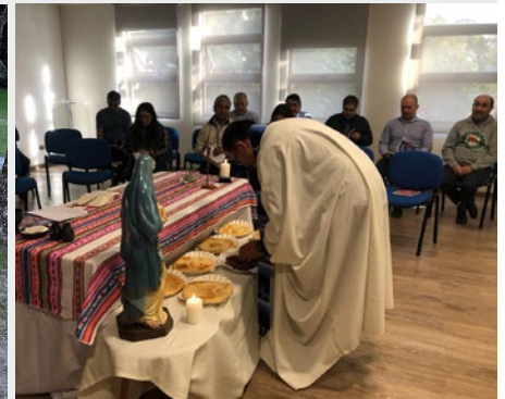
CHILE: CELEBRACIÓN DE SEMANA SANTA EN LA CASA DE ANIMACIÓN MARISTA EN SANTIAGO