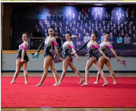
CHILE: FESTIVAL DE GINÁSTICA RÍTMICA NA ESCOLA MARISTA SANTIAGO