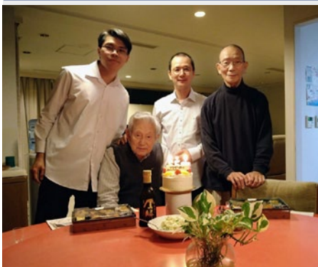
JAPÃO: COMUNIDADE MARISTA EM KOBE