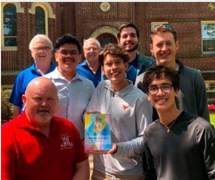
ESTADOS UNIDOS: PASTORAL VOCACIONAL CON ESTUDIANTES DE TEXAS