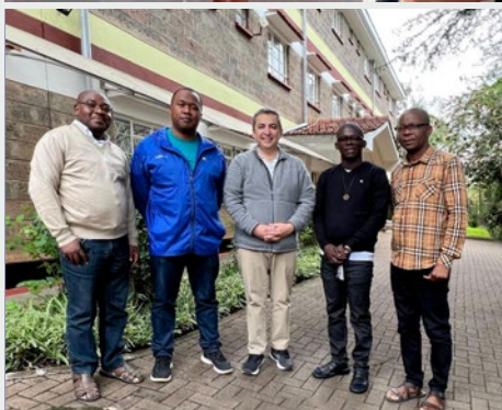
KENIA: COMISIÓN DE MISIÓN DE ÁFRICA – REUNIÓN EN NAIROBI