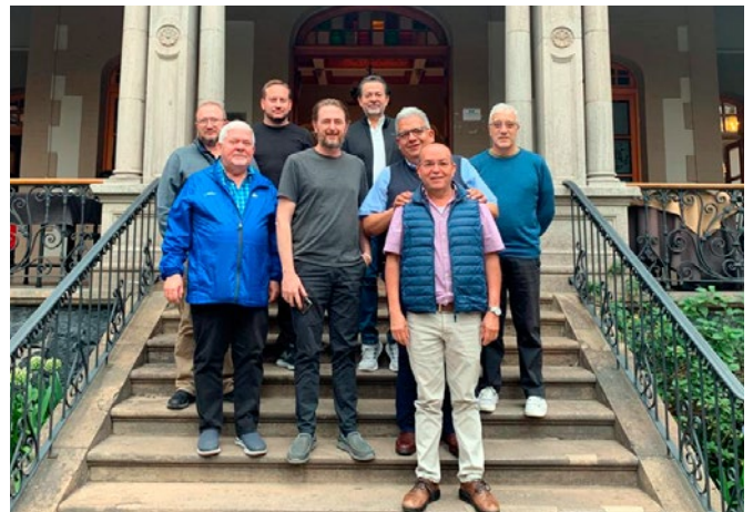
deconferencia con los demás miembros de la junta directiva de Fraters Maristen Internationalaal.