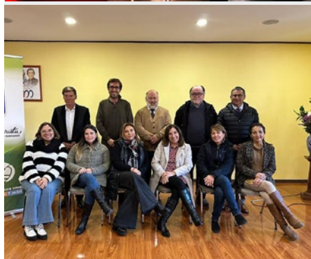
CHILE: COLEGIO MARISTA DE RANCAGUA