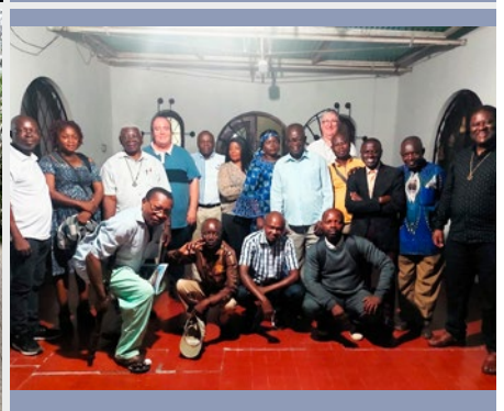
REPÚBLICA DEMOCRÁTICA DEL CONGO: HERMANOS Y LAICOS EN KINSHASA