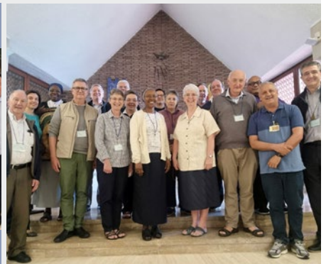
ITALIA: ENCUENTRO DE LAS CUATRO RAMAS DE LA FAMILIA MARISTA EN NEMI