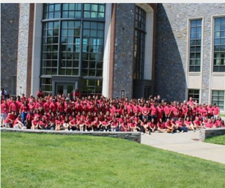
ESTADOS UNIDOS: 23º ENCUENTRO ANUAL DE JÓVENES MARISTAS EN NY