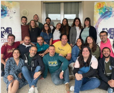
ESPAÑA: REUNIÓN DE LOS COORDINADORES DE MARCHA EN SALAMANCA