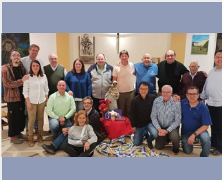
ESPAÑA: REUNIÓN DE ECONOMOS DE AMÉRICA EN COMPOSTELA