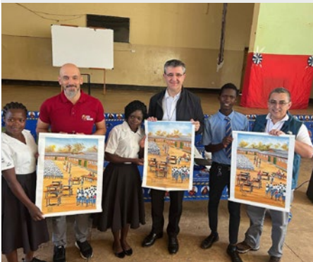
MALAWI: NEW HORIZONS