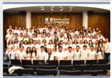
MÉXICO: XII SIMPÓSIO DE INVESTIGAÇÃO: GENÉTICA MÉDICA, UNIVERSIDAD MARISTA DE MÉRIDA.