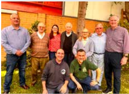
CHILE: REUNIÃO DO SECRETARIADO DOS LEIGOS