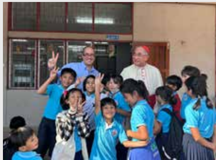
TAILÂNDIA: PRIMEIRA VISITA DO CARDEAL DE BANGKOK AO NOVO CENTRO MARISTA DE ENSINO