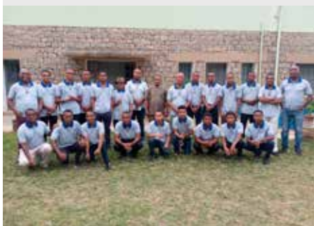
MADAGASCAR: ABERTURA DE POSTULANTADO EM AMPAHIDRANO FIANARANTSOA