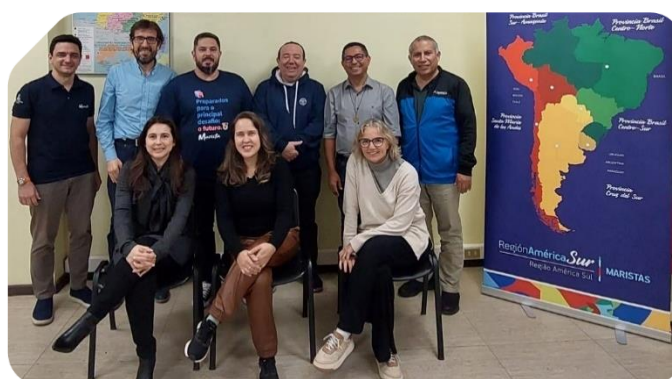
Equipe de Educação da Rede de Escolas da Região América Sul em Santiago, Chile.

Em visita ao Colégio Marista de La Pintana, Marcelino Champagnat, os membros da rede tiveram a oportunidade de conhecer as iniciativas de processos estratégicos e o Programa de Educação Integral que estão sendo realizados. A equipe esteve também no Instituto Alonso de Ercilla, Escola Marista de Santiago, onde se reuniu