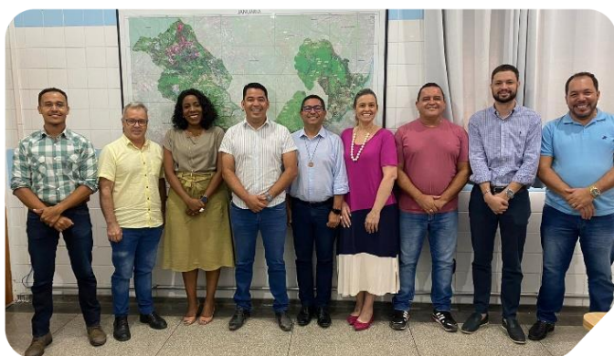
Equipe Marista Centro-Norte em reunião com o prefeito de Januária e a equipe da Secretaria de Educação.

Alinhado ao compromisso de expansão de sua rede e à missão de promover uma educação integral, evangelizadora e de excelência para crianças, adolescentes e jovens, o Marista Centro-Norte chega ao Município de Januária (MG).