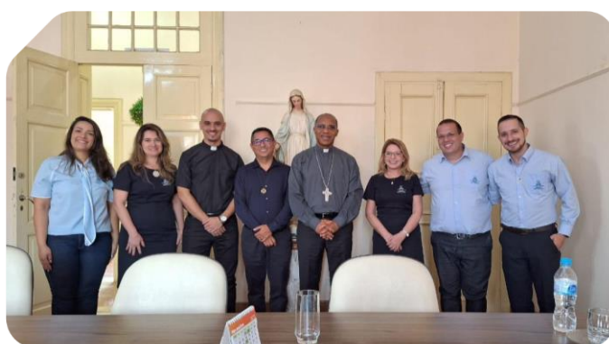
Equipe do Colégio Marista de Varginha em visita ao Bispo da Diocese da Campanha.

Na oportunidade, foi apresentado o portfólio das Atividades Pastorais e de Solidariedade 2023, da Assessoria de Missão do Colégio Marista Varginha, com um breve resumo dos projetos desenvolvidos no colégio e seus objetivos. Entre os projetos desenvolvidos estão: Campanha da Fraternidade, Semana Pastoral, Acolhida Marista - AMAR, Amiguinhos de Champagnat, Infância Missionária Marista, Pastoral Juvenil Marista - PJM, Catequese - Eucaristia, Voluntariado Estudantil Marista - VEM, Núcleo Animação Vocacional Semana Vocaciona, Missão Marista de Solidariedade - MMS, Encontros de Formação, Mariama dos Educadores e Auto de Natal. Também foram destacadas as demais iniciativas pastorais que