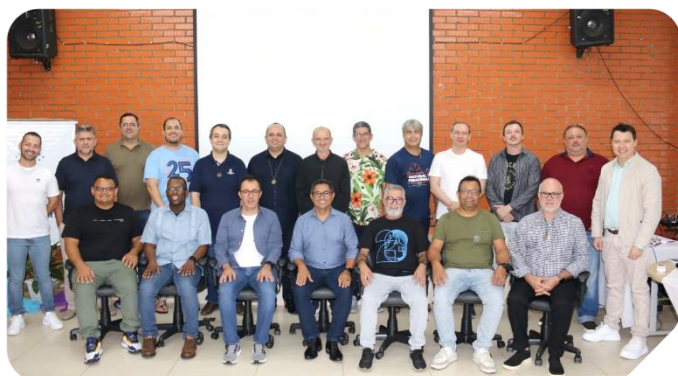
Participantes da 20ª Assembleia Ordinária da Umbrasil.

Entre os dias 19 e 21 fevereiro, na Vila Champagnat, em Brazlândia (DF), ocorreu a Assembleia Geral Ordinária da União Marista do Brasil (Umbrasil) , com o objetivo de dialogar e deliberar sobre os projetos do Brasil Marista, bem como celebrar sua vigésima edição. As províncias que compõem o Brasil Marista, representadas por 21 Irmãos, celebraram a 20ª AGO, que teve como tema: “De L’Hermitage a Brasília - Somos família global com pertencimento e responsabilidade” , e vivenciaram a vida fraterna a partir da iluminação bíblica: “Os que abraçavam a fé viviam unidos e possuíam tudo em comum” (At 2, 44).