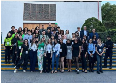
MÉXICO: ENCUENTRO NACIONAL CULTURAL MARISTA EN GUADALAJARA