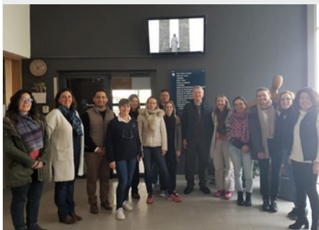
FRANÇA: CURSO DE FORMAÇÃO "SER PROFESSOR E EDUCADOR EM UMA ESCOLA MARISTA"