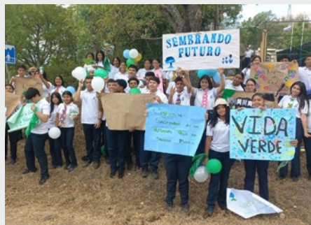
NICARÁGUA: CAMPANHA ANUAL DE ESTUDANTES "ADOpte UMA ÁRVORE" EM ESTELÍ