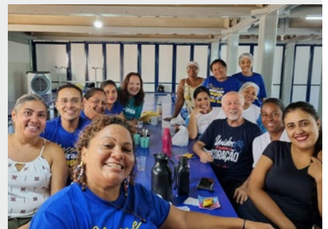
BRASIL: ESCOLA MARISTA GUADALUPE, JANAÚRIA