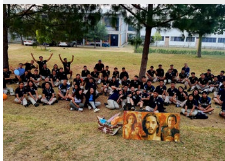
GUATEMALA: ENCONTRO DA PASTORAL JUVE- NIL REMAR 2024