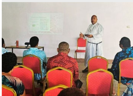
FIJI: PROGRAMA DE SENSIBILIZAÇÃO PROFIS- SIONAL DA EQUIPA DE FORMAÇÃO