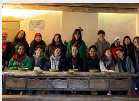
FRANÇA: INTERCÂMBIO INTERNACIONAL DE ESTUDANTES MARISTAS NO HERMITAGE