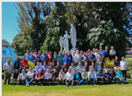
MÉXICO: ASSEMBLEIA INTERPROVINCIAL EM GUADALAJARA