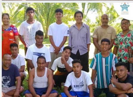
KIRIBATI: PROGRAMME "COME AND SEE" À LAVALLA, BIKENIBEU