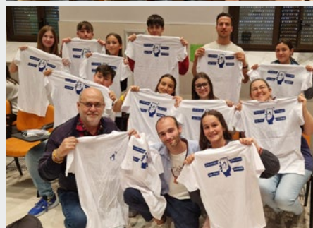
MEDITERRANÉE: ASSEMBLÉE PROVINCIALE DES JEUNES