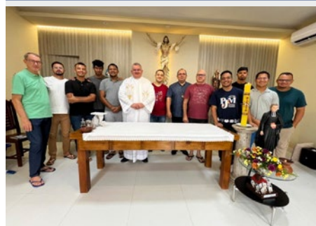
LES PROVINCIAUX BRÉSILIENS AU POSTULAT DE FORTALEZA