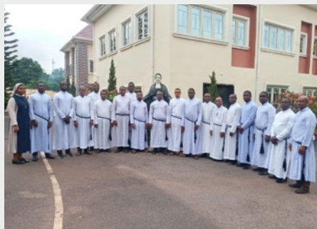
NIGERIA: COURS DE FORMATION PERMANENTE POUR LES FRÈRES PROFÈS TEMPORAIRES