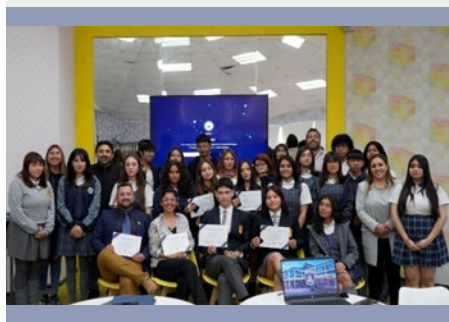
CHILI: MEMBRES DU PROJET DE RÉSEAU DE PARTICIPATION DES JEUNES