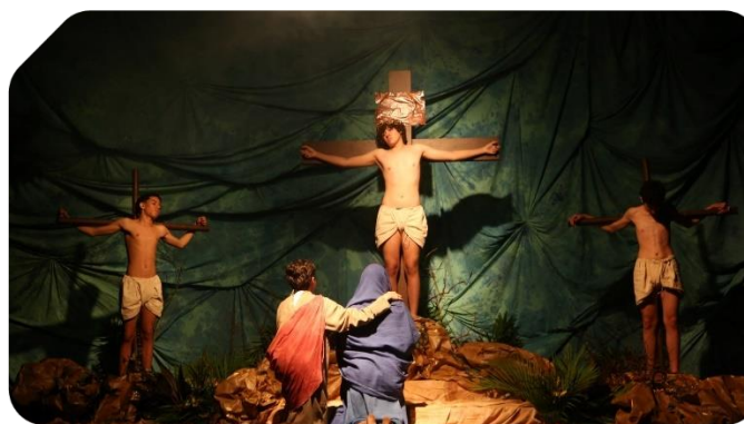
Paixão de Cristo 2024 apresentada pelo Colégio Marista Patamares.

No Colégio Marista Patamares, os estudantes da Educação Infantil (EI) ao Ensino Fundamental Anos Iniciais (EFAI) imergiram na simbologia da Semana Santa e no significado da data. Os estudantes colheram ramos, fantasiaram-se, representando a experiência em Jerusalém e a Santa Ceia. Assim, os estudantes receberam pães e suco de uva, símbolos da carne e do sangue de Jesus. Por fim, foi realizada