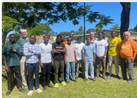
MALAWI: POSTULANTADO DA PROVÍNCIA DA ÁFRICA AUSTRAL, MTENDERE