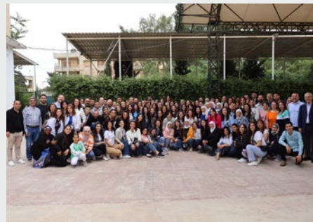
SÍRIA: CELEBRAÇÃO DO DIA DOS MARISTAS AZUIS DE ALEPPO EM 6 DE MAIO