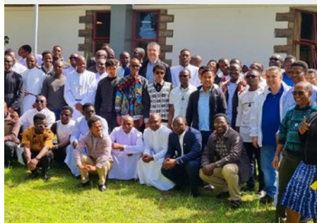
QUÊÊNIA: MARIST INTERNATIONAL CENTER (MIC), NAIROBI