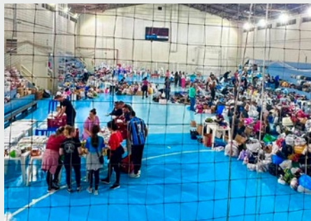
BRASIL: SOLIDARIEDADE NO COLÉGIO MARISTA ROSÁRIO COM OS DESABRIGADOS DA ENCHENTE