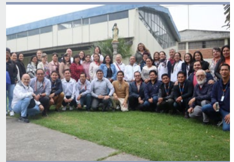
EQUADOR: ENCONTRO DE DIRETORES DE INSTITUIÇÕES EDUCATIVAS MARISTAS