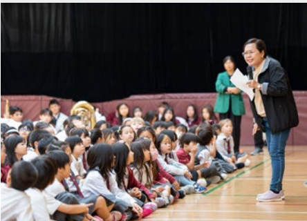
JAPÃO: ESCOLA INTERNACIONAL MARISTA, KOBE