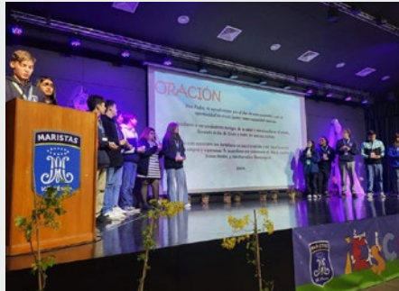
CHILE: REUNIÃO DOS CENTROS MARISTAS DE ESTUDANTES 2024