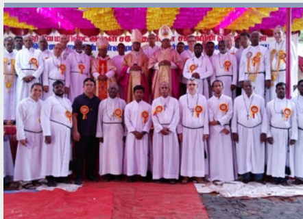
ÍNDIA: COMEMORAÇÃO DOS 50 ANOS DE PRESENÇA