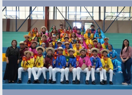
EL SALVADOR REUNIÓN INTERCOMUNITARIA MARISTA