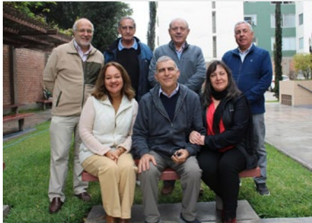
PERÚ REUNIÓN PROVINCIAL DEL CONSEJO DE ASUNTOS ECONÓMICOS