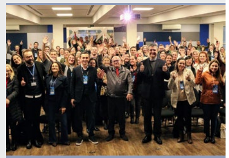
BRASIL CENTRO-SUL : MES DE LA ÉTICA Y LA CONFORMIDAD» PROMOVIDO POR LA PROVINCIA