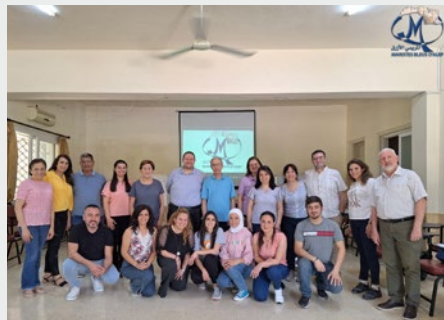
SIRIA FORMACIÓN DE RESPONSABLES DE PROYECTOS DE LOS MARISTAS AZULES EN ALEPO