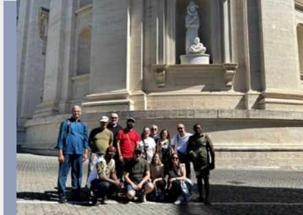
VATICANO: PARTICIPANTES EN LA ASAMBLEA DE SOLIDARIDAD VISITAN LA ESTATUA DE CHAMPAGNAT