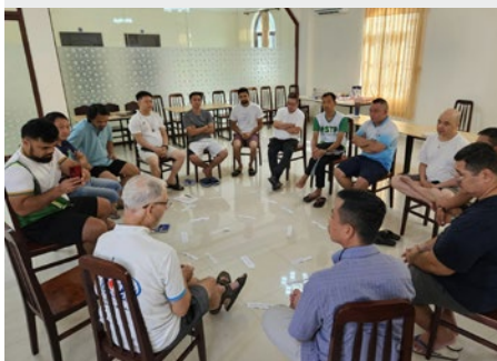
VIETNAM: PROGRAMA DE PREPARACIÓN A LA PROFESIÓN PERPETUA