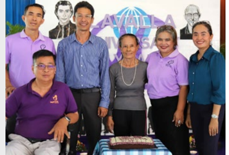
CAMBOYA: 26º ANIVERSARIO DE LA FUNDACIÓN DE LAVALLA