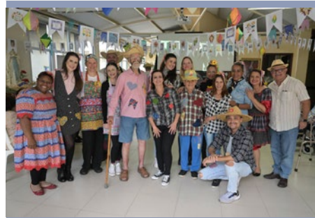
BRASIL: FIESTA DE SAN JUAN EN SÃO JOSÉ DOS PINHAIS