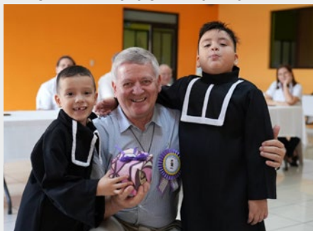
EL SALVADOR: EL H. ERNESTO EN LA CELEBRACIÓN DEL CENTENARIO DE PRESENCIA MARISTA EN EL LICEO SALVADOREÑO