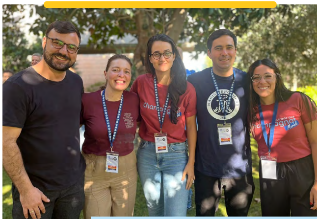
Representantes das Províncias da Região América Sul e Umbrasil

De 29 de outubro a 1º de novembro, o Instituto realizou, pela primeira vez, o Encontro Internacional Marista de Comunicação e Marketing na Casa Geral, em Roma, que reuniu 37 Irmãos, leigos e leigas comunicadores da vida e missão maristas de cada unidade administrativa e das instituições. Com o slogan “Caminhando como Família Marista Global”, o evento priorizou refletir e aprofundar sobre a comunicação e o marketing nas instituições religiosas no contexto da sociedade e da Igreja de hoje, viabilizar a troca de conhecimentos para o aprimoramento dos processos da área, criar uma cultura de trabalho em rede, além de construir uma visão e direção comuns para comunicação e marketing de todo o Instituto.