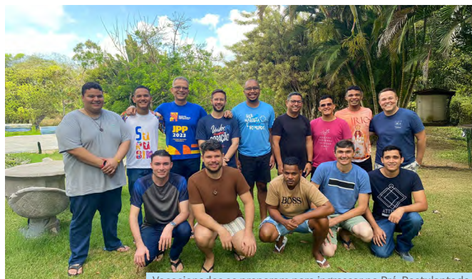
Vocacionados se preparam para ingressar no Pré-Postulante